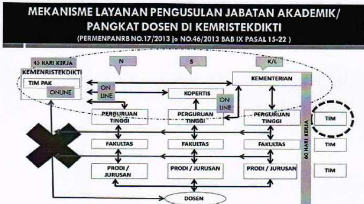
Gambar 1. Mekanisme Layanan Pengusulan Jabatan Akademik/Pangkat Dosen

Kenaikan jabatan akademik/pangkat dosen merupakan bagian tidak terpisahkan dengan pengembangan karir dosen, dengan demikian mekanisme penilaian dan proses kenaikan jabatan akademik/pangkat dosen akan diintegrasikan secara online (daring). Dengan sistem daring diharapkan dapat meningkatkan efisiensi layanan dan mendukung prinsip-prinsip penilaian, sebagaimana pada Gambar 1.