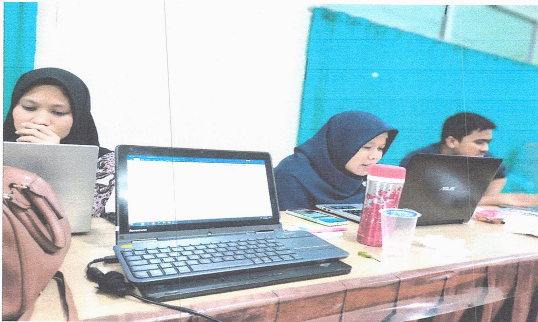
Lampiran: Foto Rapat Tanggal 9 Maret 2023 Program Studi Teknik Kimia Fakultas Teknik UNIVAL