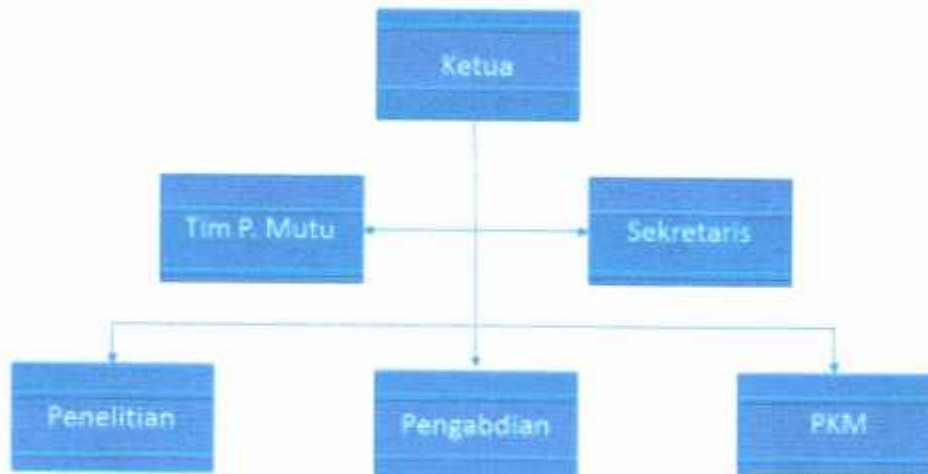
Gambar 5.1 Organisasi LPPM Universitas Al-Khairiyah

Secara operasional penelitian sesuai dengan tema penelitian dalam RIP, diselenggarakan oleh dosen-dosen yang bekerja di laboratorium di berbagai Program Studi serta dosen yang bekerja di Pusat Kajian dan Studi masing-masing Program studi. Supaya penelitian yang dilakukan mencapai tujuan yang direncanakan, dibentuk Tim Pengembangan Mutu Penelitian, didalamnya tercakup Bidang Penjaminan Mutu, Bidang Monitoring dan Evaluasi serta Bidang Pengaduan. Struktur tersebut digambarkan sebagai berikut :