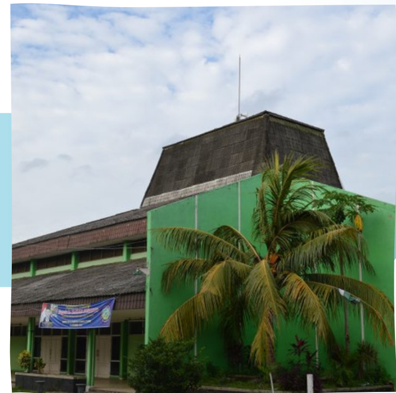
GEDUNG SERBA GUNA